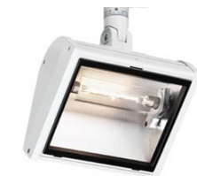
Wing Wall Washer