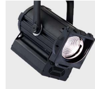
Astral Axial Zoomspot