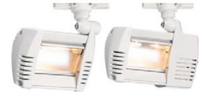
Aureol Fresco Flood