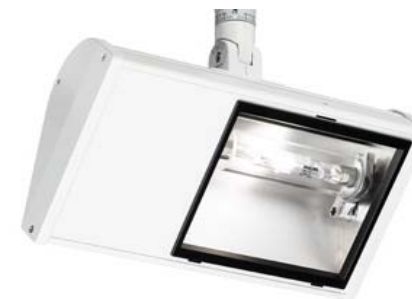
Wing Wall Washer 70W