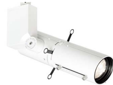
Selecon Display Projector 15-35°